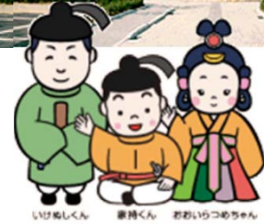
いげんくん 義経くん お若いらつめちゃん