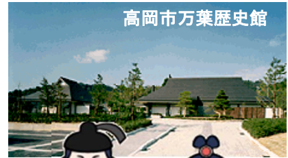
高岡市万葉歴史館