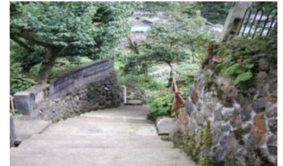
だんぞらまいの坂